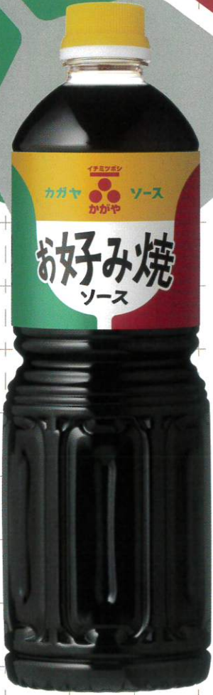
イチミツボシ お好み焼ソース 1L/450g