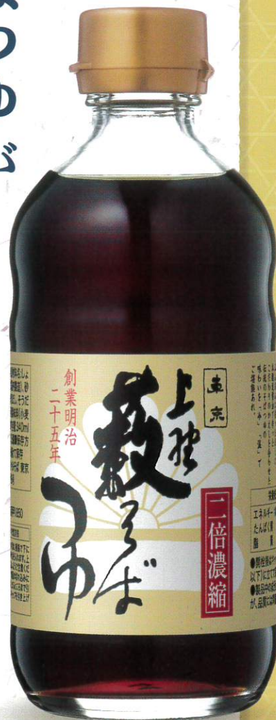
上野藪そばつゆ 2倍濃縮 340ml